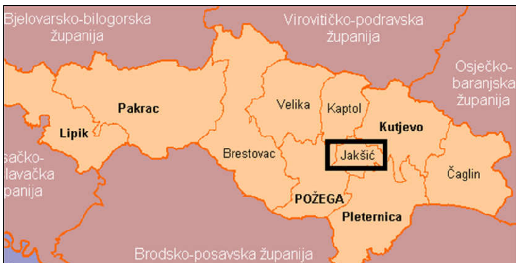
Slika 1: Administrativne granice Općine Jakšić unutar Požeško-slavonske županije

Općina Jakšić smještena je u središtu Požeške kotline i prostire se na 44,85 kvadratnih km. Općinsko središte je Jakšić, selo na cesti Požega - Našice, jedinica lokalne samouprave u Požeško-slavonskoj županiji. Jakšić je udaljen od središta županije, tj. Požege samo 7 km. Jakšićki kraj po središnjem položaju u Požeškom polju ima mnogo plodnih ravnica. Jakšić je smješten na blagom brdašcu, na mjestu gdje je u srednjem vijeku bilo naselje Sv. Đurđa (po crkvi sv. Đurđa). Općina Jakšić obuhvaća 10 naselja: Bertelovci, Cerovac, Eminovci, Granje, Jakšić Rajsavac, Svetinja, Tekić, Treštanovci i Radnovac, a prema posljednjem popisu stanovništva iz 2011.godine na području Općine Jakšić živjelo je 4.058 stanovnika u 1.210 kućanstava.