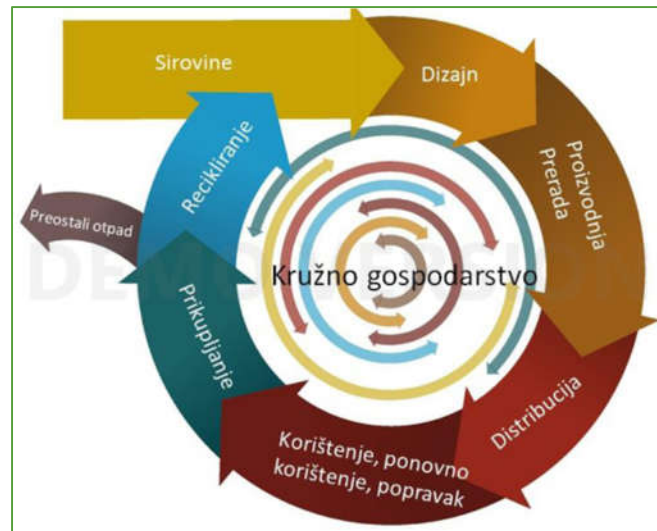
Slika 4: Model kružnog gospodarstva (Izvor: Plan gospodarenja otpadom RH 2017.-2022.godine)

Za prelazak na kružno gospodarstvo potrebne su promjene u cijelom lancu vrijednosti, od učinkovitog upravljanja resursima, dizajna proizvoda, novih poslovnih i tržišnih modela, novih načina pretvaranja otpada u resurse do novih modela ponašanja potrošača.